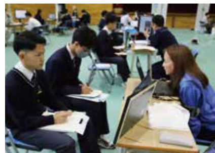
大規模進学就職合同説明会 (企業31社・大学短大10校・専門学校11校)