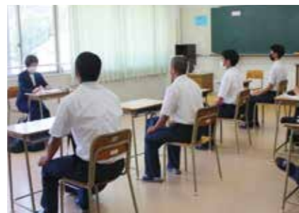
面接指導 (民間企業採用担当によるプロの指導)