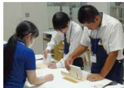
全員参加 インターンシップ