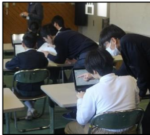
プログラミング 山田小学校・玉原小学校