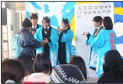
ステージやビンゴで今年も大勢の人が集まりました