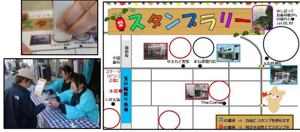
地域の企業へ協賛金をお願いし、ご協力いただきました